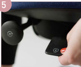
ARRETIERUNG DER NEIGUNGS- MECHANIK ENTRIEGELN