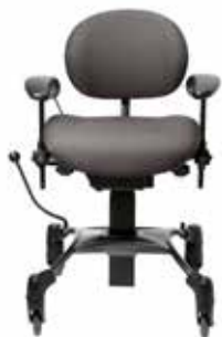
VELA Tango 100

Ergonomie und Komfort sind von höchster Qualität und alle Modelle sind mit einer vielfältigen Auswahl an Sitzen und Rückenlehnen erhältlich, sodass sich die Stühle individuell anpassen lassen.