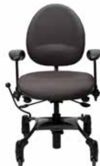
VELA Tango 200